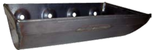
Starco Jumbo 8 inch elevatorbekers in gelaste uitvoering (afmetingen in mm)